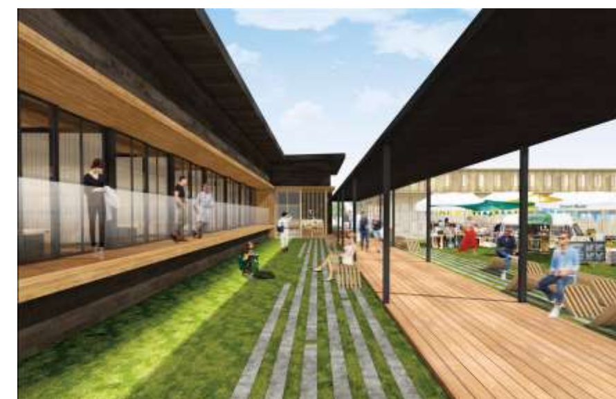
■海鮮バーベキューレストランファサード