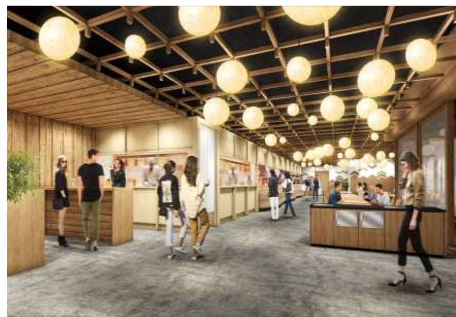
■フードホール内部