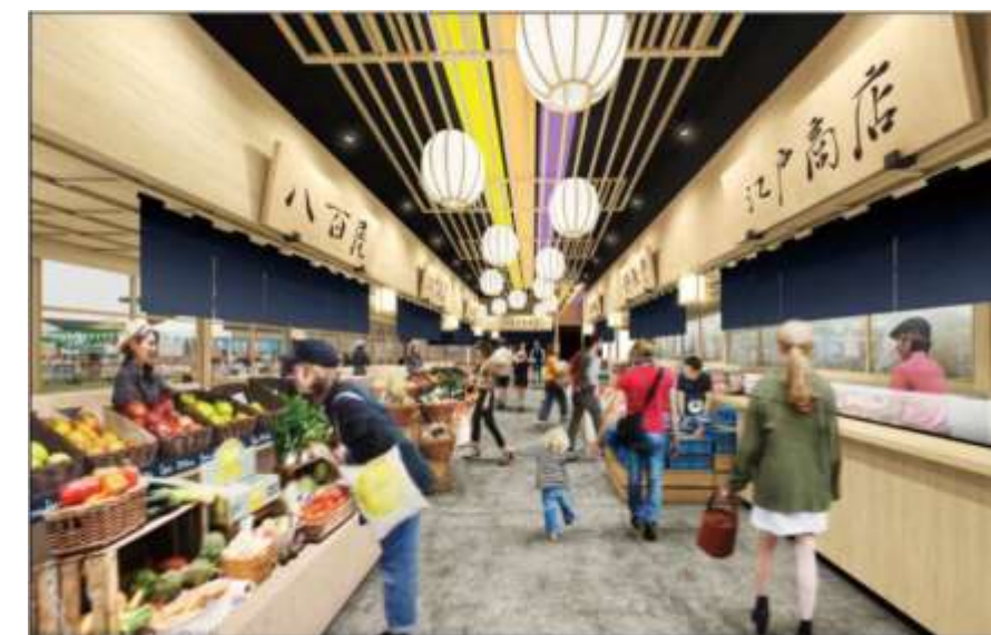
■物販・マルシェ棟内部