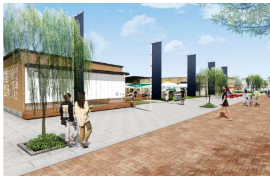
■フードホールファサード