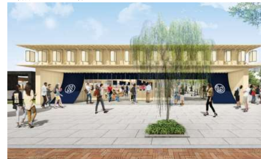
■物販・マルシェ棟ファサード